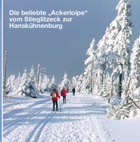
Die beliebte „Ackerleife“ vom Stieglitzeck zur Hanskühnenburg

Die Skigebiete der Oberharzes erreicht man im Winter von der Hütte aus ebenso schnell, wie die Okertalsperre, die im Sommer ideale Wassersportmöglichkeiten bietet.